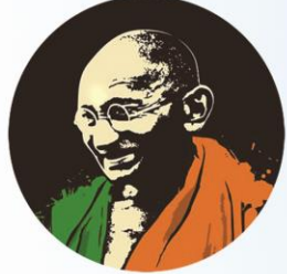
মোহনদাস কৰমচাঁদ গান্ধী