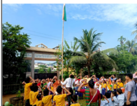
फालिथाइ सान जर'खायै फुंनि आफाद आलारि बाथि फोजोंनाय, थांखि बेखेवनानै सानजौफुनि जानाय जिअयनायनि उनाव गुबुन सोमोन्दो गोनां आफाद खुंगोन ।

उदांसि सोमावसारनायनि लोब्बा थानाय सावगारि, सॉलु, हादर अनफावरि मेथाइ बादाय लायनाय खुंगोन । गासिबो हाबाफारि फोजोबना हायुडरि मेथाइ खनगोन ।