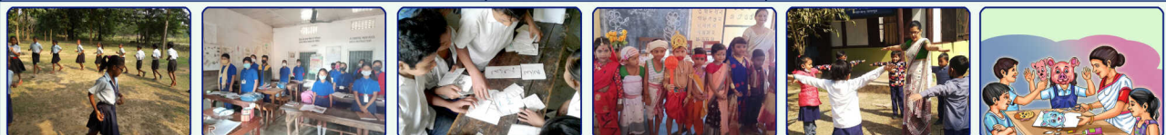
क थाखोनिफ्राय थाम थाखोनि सानफोमबोनि फोरोंनाय खामानिनि थाखाय फोरोंगिरिया फराबिजाबजौ लोगोसे 'निपुन आसाम' मिछनआ होनाय फोरों-सोलो आगजुफोरखौ बाहाय ।